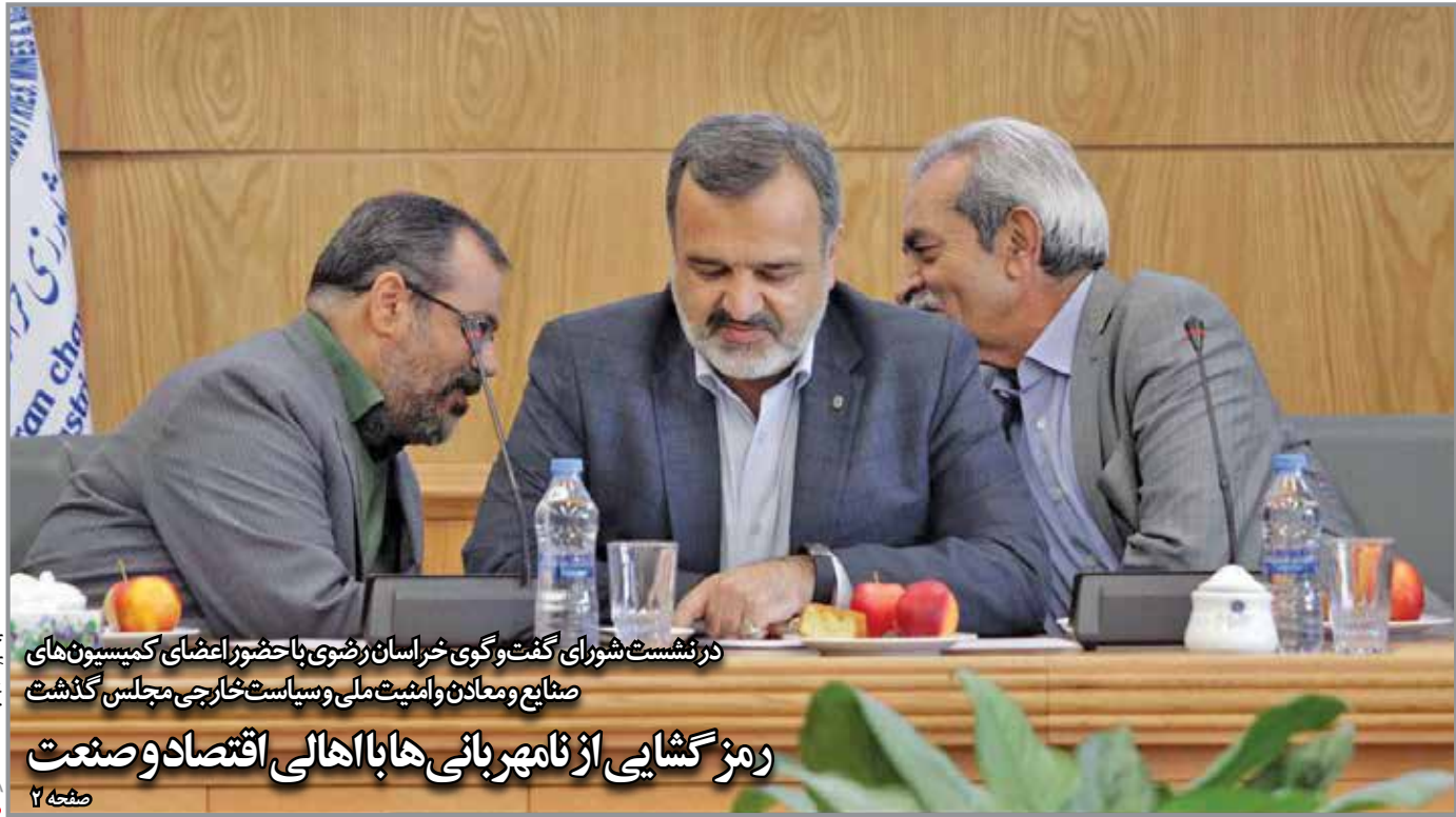
در نشست شورای گفت‌وگوی خراسان رضوی با حضور اعضای کمیسیون های صنایع و معادن و امنیت ملی و سیاست خارجی مجلس گذشت